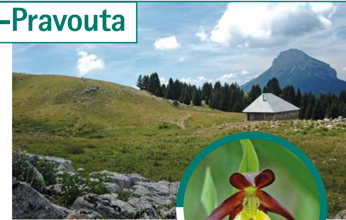
Sabot de Vénus